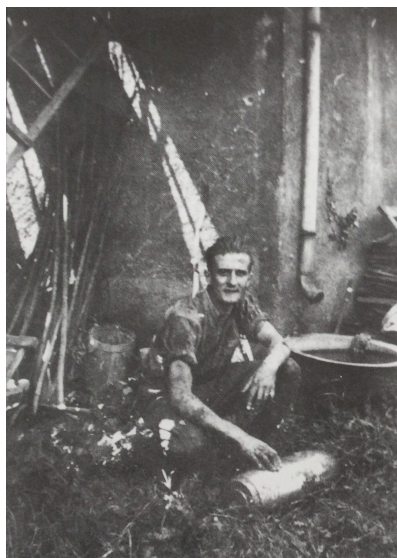
Figure 3 : Photo prise par Mme Gendreau (âgée de 15 ans en 1940) d'une bombe non éclatée avec un artificier (source : Alain Bisson)

Après le passage des avions, le danger n'est pas immédiatement écarté. Par crainte d'un nouveau bombardement, beaucoup quittent la commune ou rejoignent des abris. De plus, des bombes sont tombées mais n'ont pas éclaté ce qui est très dangereux, elles peuvent exploser à tout moment et ne sont pas toujours retrouvées rapidement. Il n'est pas rare encore aujourd'hui, de retrouver lors de travaux des bombes de la Seconde Guerre mondiale, le 7 mars 2021 ce fut le cas à Lyon par exemple. Pour celles qui sont retrouvées rapidement après le bombardement, elles sont soigneusement ramassées par des artificiers militaires chargés de leur destruction.