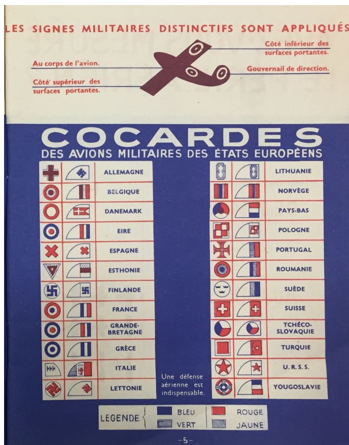
Figure 5 : ŒUVRE POUR LA SÉCURITÉ ET L'ORGANISATION DES SECOURS, Manuel de défense passive: le danger, les moyens de protection, Paris, France, S.O.S, 1938.

Toutes les recherches menées tendent pourtant à prouver que ces bombardements sont bien allemands. L'historienne Alya Aglan évoque en plus des rumeurs, des « hallucinations collectives » 64 qui auraient conduit après-guerre à accuser les Italiens du bombardement et du mitraillage de civils en France. Il est tout de même étonnant qu'à des dates et endroits différents des civils restent persuadés encore aujourd'hui d'avoir aperçu ces cocardes. Mais les ont-ils réellement vues ? D'après le tableau ci-dessus, les seules nations qui ont des cocardes tricolores avec du blanc et du rouge sont la France et le Royaume-Uni, le bleu pouvant être confondu avec du vert. Il est évident que ces deux pays ne peuvent être responsables des bombardements. Si, et nous restons ici dans le domaine de l'hypothèse, ces personnes ont véritablement vu des cocardes sous les avions, la