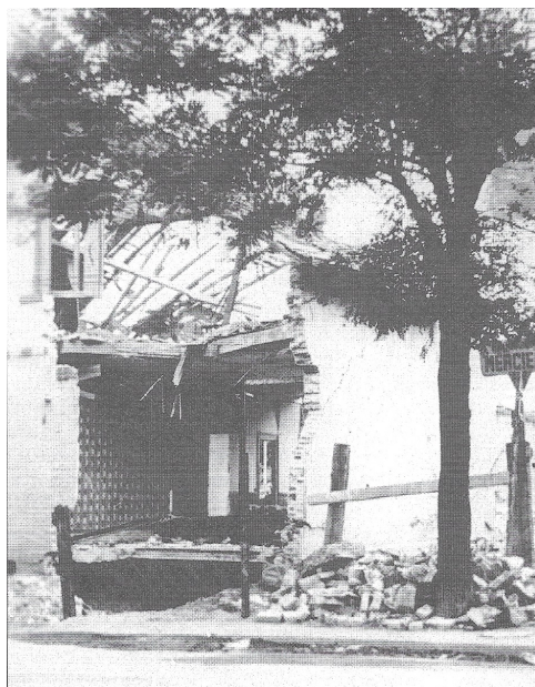
Figure 1 : Avenue Jules Guesde à Montluçon. Épicerie Chaumeil. Photo de Mme Favière-Sarrassat (Source : Alain Bisson)

J'habitais l'immeuble qui fait l'angle des rues Denis Papin et Jean-Jacques Rousseau. Je me souviens qu'il n'y avait pas eu d'alerte, seulement une terrible explosion qui fit voler les vitres en éclats. Sous le choc, j'ai lâché la blouse que je lavais. Mon premier réflexe a été de descendre dans la rue pour savoir ce qu'il était advenu de ma sœur âgée de six ans qui jouait dehors sur les marches. Je l'ai trouvée qui gisait dans son sang, affreusement mutilée... Elle mourut le lendemain à l'hôpital où elle avait été transportée. 34