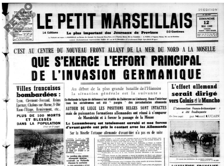
Figure 4 : Le Petit Marseillais du 12 mai 1940, consulté sur RetroNews

Comme nous pouvons le voir ci-dessus avec la une du Petit Marseillais , tous les journaux nationaux parlent notamment du bombardement de Clermont-Ferrand du 10 mai 1940. En réalité, si les informations sur l’alerte et le nombre de victimes sont réelles, il ne s’agit pas de Clermont-Ferrand mais des Ancizes-Comps et plus précisément de l’Acierie qui a été visée. Cela témoigne d’une multitude de fausses informations qui circulent durant cette période et le journal local La Montagne s’en agace. Dans sa tribune « Nouvelles et fausses nouvelles » de l’édition du 12 mai, voici ce que nous pouvons lire :