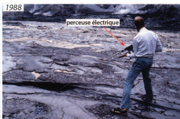
Figures 4 : mesures de viscosité de la lave sur le terrain avec des viscosimètres rotatifs.

À gauche : H. Pinkerton utilise le premier viscosimètre rotatif dans un chenal de lave sur l'Etna en 1976 (Pinkerton & Sparks, 1978). L'instrument est une simple manivelle qu'il faut tourner à la main.