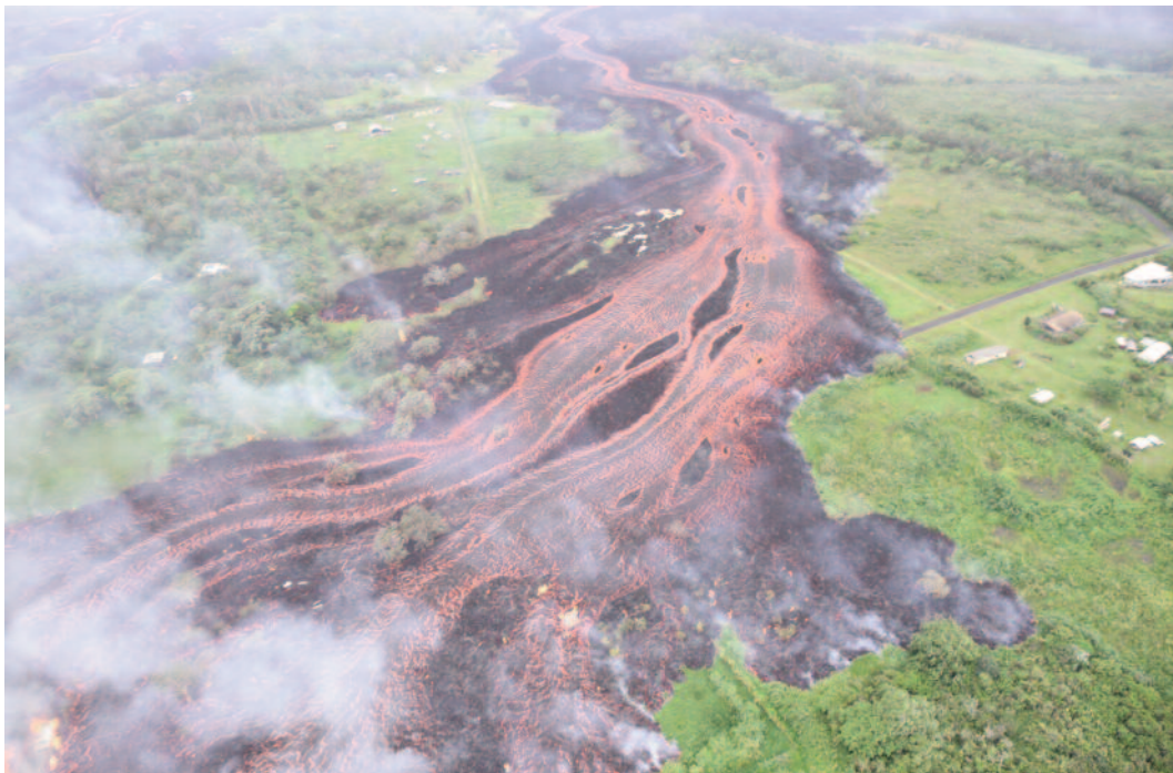
Figure 1 : coulée de lave (écoulement du haut vers le bas) provenant de la fissure 16-20 de l'éruption du volcan Kīlauea le 19 mai 2018, Hawaï.

Hormis cet exemple, dans la plupart des cas, les coulées de lave sont assez lentes pour permettre aux populations d'évacuer. Cependant, même si les pertes humaines dues aux coulées de lave sont minimales comparées à celles dues aux éruptions explosives, les coulées de lave détruisent absolument tout sur leur passage (figure 1), ce qui peut avoir des répercussions durables sur les économies locales.