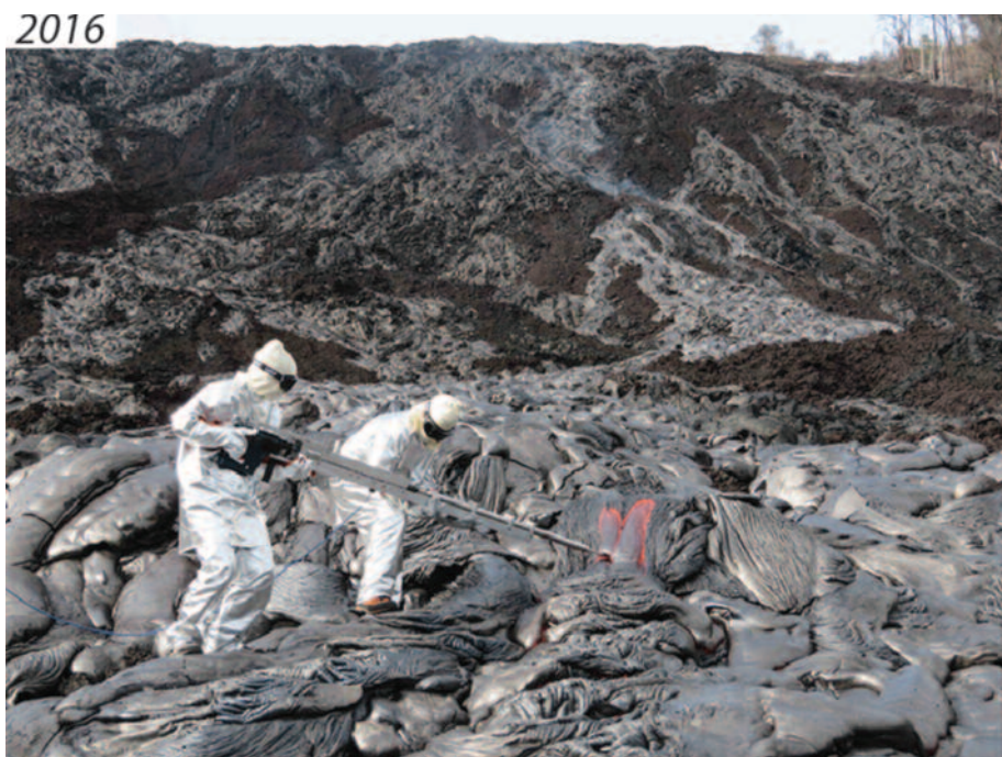
Figures 5 : mesures de viscosité des laves pahoehoe au Kilauea en 2016 (Chevrel et al., 2018). L'instrument est le même viscosimètre rotatif à moteur conçu par H. Pinkerton mais adapté pour les laves silicatées. La rénovation de l'instrument en 2016 (après 20 ans hors service) a permis le fonctionnement d'un système d'enregistrement en temps réel. Deux personnes sont nécessaire pour maintenir l'instrument dans la lave et deux autres personnes (situés à gauche hors champs) pour l'acquisition des données.

Nous espérons prochainement pouvoir l'utiliser afin d'établir des séries de données qui permettront d'améliorer nos modèles numériques. □