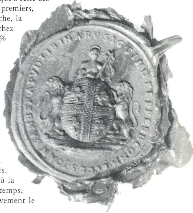
Sceau de la communauté d'Ambert, (XVII e s), avec les armes de la ville.