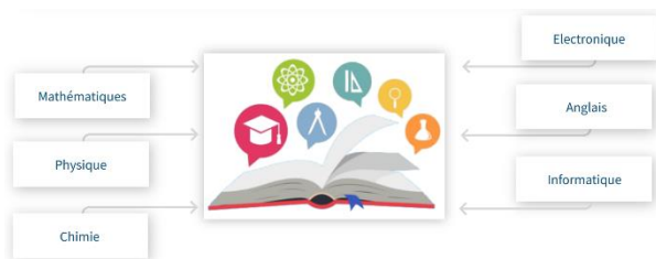
Fig. 1 : Matières thématiques du projet OpenING

Cet article se concentre sur la matière électronique, mais le projet OpenING couvre un large spectre de matières scientifiques (6 au total comme indiqué dans la figure ci-dessous) auquel ont participé les enseignants des écoles Polytech inscrits dans cette démarche de conception et de mise en place d'une pédagogie hybride.