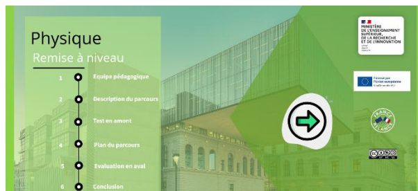
Fig. 3 : Exemple de parcours de remise à niveau

Concrètement, un parcours de remise à niveau regroupe les grains d'une matière et permet une formation en ligne autonome, afin de favoriser la révision ou l'acquisition de notions par les étudiants comme illustré à la figure ci-dessous :