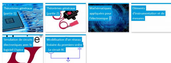
Fig. 4 : Les grains de la matière électronique

Dans ce contexte, il nous a semblé important de reprendre les bases de la matière sur plusieurs aspects comme indiqué à la figure 4 : les théorèmes généraux de l'électronique, les outils mathématiques associés à l'étude des circuits, les notions cruciales de modélisation et de simulation et finalement des éléments instrumentations (pour les aspects pratiques).