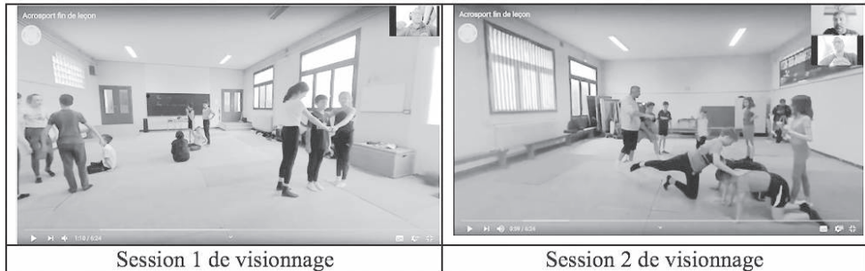
Figure 3 : Dispositif à distance de recueil des données

et il lui a été possible de l'utiliser à tout moment. Une semaine plus tard, une deuxième session a été organisée dans les mêmes conditions, mais avec la consigne de regarder deux fois la vidéo 360° : une première fois en se centrant sur l'activité de l'enseignant et une seconde fois sur celle des élèves.