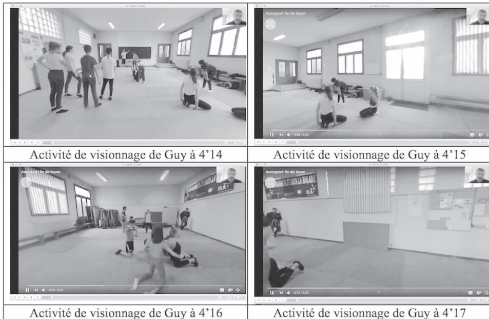
Figure 4 : Captures de l'activité de navigation dans la vidéo 360°

implacable décours temporel, source d'urgence à saisir tout ce qui s'y passe pour ajuster son intervention.