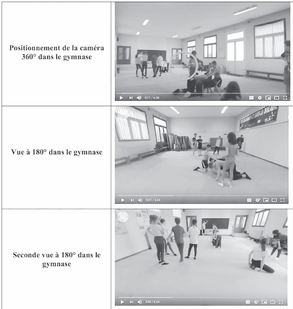
Figure 2 : Positionnement de la caméra et points de vue offerts au visionnage