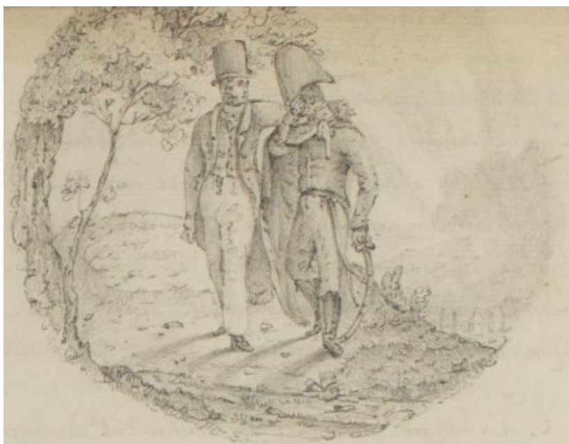
BASLAL, Ms 244. Dessin au crayon illustrant Le Proscrit ou le Siège de Lyon , 1824

Ses débris en tombant écraseraient vos têtes » 36 .