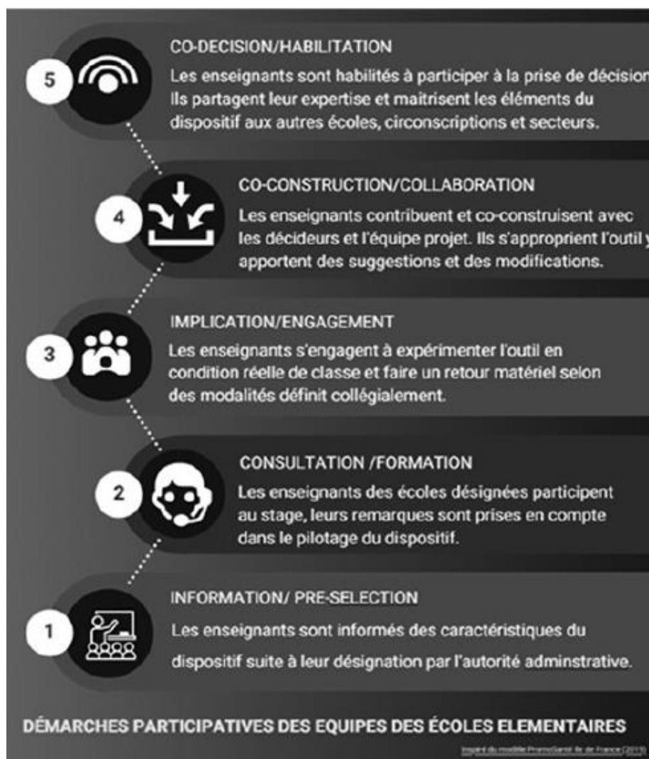
Figure 1 : Grille d'analyse de la participation

Différentes caractérisations de la participation existent en fonction des domaines d'intervention. Des échelles de participation citoyenne [22, 23] au Montreal Model [24]. Nous avons choisi de nous appuyer sur la synthèse réalisée en 2019 par PromoSanté Île-de-France [25] déclinée en cinq niveaux que nous avons adaptés à l'étude (figure 1).