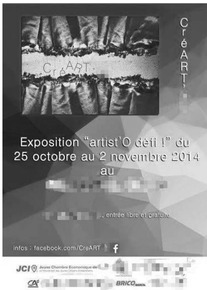
Figure 2 : Remise des prix aux lauréats à l'occasion de la fin de l'exposition organisée par la JCEL