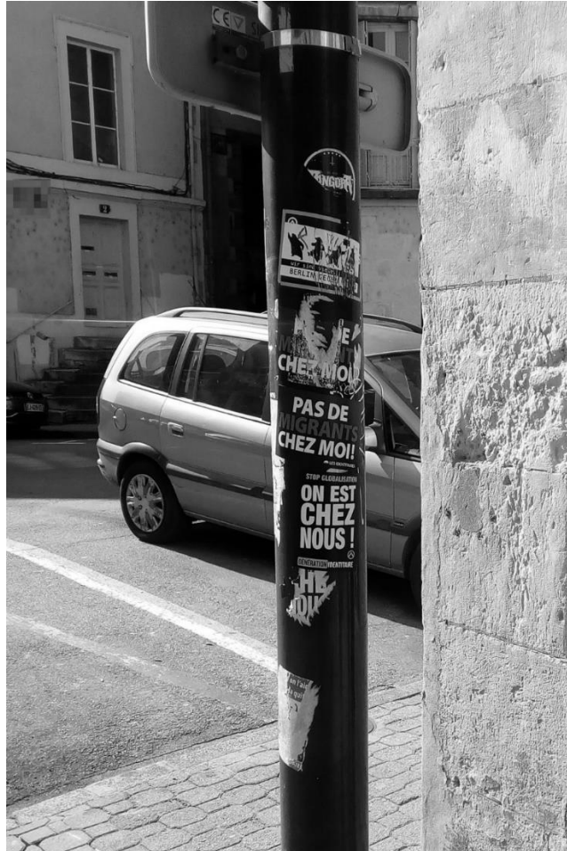
Figure 5 : Des autocollants du mouvement politique « Génération identitaire » dans le centre-ville