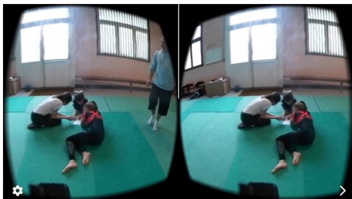
Situation de visionnage avec visio-casque