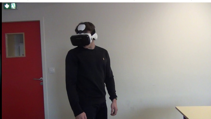
Figure 2. Usage des visio-casques en présentiel

permettre à la personne qui visionne de choisir et de pouvoir changer d'angle de vue. Le contexte sanitaire décrit nous a conduits à accélérer l'usage de ce type de vidéo en ligne.