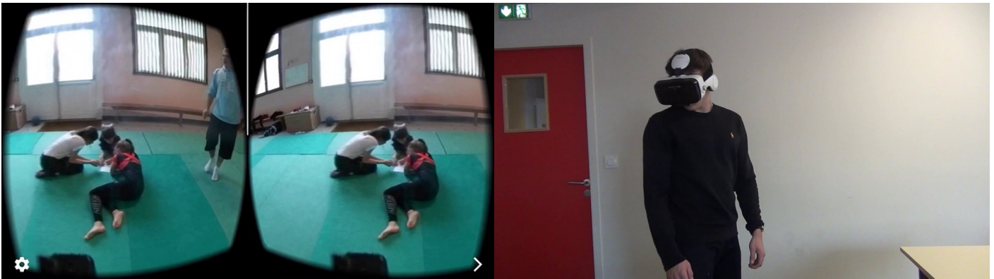
Figure 2. Usage des visio-casques en présentiel

permettre à la personne qui visionne de choisir et de pouvoir changer d'angle de vue. Le contexte sanitaire décrit nous a conduits à accélérer l'usage de ce type de vidéo en ligne.