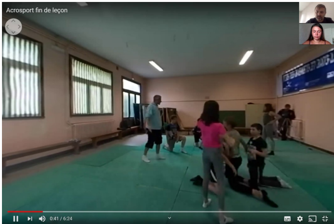
Figure 3. Capture d'écran du partage de la vidéo 360° lors d'un TD

saisir les caractéristiques des situations d'enseignement/apprentissage et les resituer dans leur contexte original dont le décours de la leçon globale (Roche et Gal-Petitfaux, 2017 ; Roche et Rolland, 2020b). Les vidéos 360° peuvent aussi être visionnées sur smartphone avec ou sans visio-casque (Figure 2).