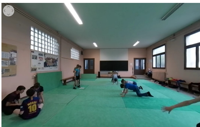
Figure 1. Exemple d'une vidéo 360° tirée de la plateforme Form@tion360

conduit les formateurs à relever un double challenge : assurer des cours à distance et permettre la continuité de la formation professionnelle des futurs enseignants d'éducation physique, articulée à des expériences vécues in situ (expériences d'observation et/ou d'intervention). Dans ce contexte, nous avons opté, en tant que formateurs, pour l'usage de vidéo à 360° de situations réelles de classe. Le projet Form@tion360 (Roche, 2020a, financement IDEX-ISITE 16-IDEX-0001, CAP 20-25) est développé depuis septembre 2018, au sein de l'UFR-STAPS (Unité de Formation et de Recherche en Sciences et Techniques des Activités Physiques et Sportives) de l'Université Clermont Auvergne (France). L'objectif est d'accompagner la formation professionnelle des futurs enseignants en utilisant des ressources vidéo dont le format est de 360° (Figure 1). La spécificité de ce format vidéo est de