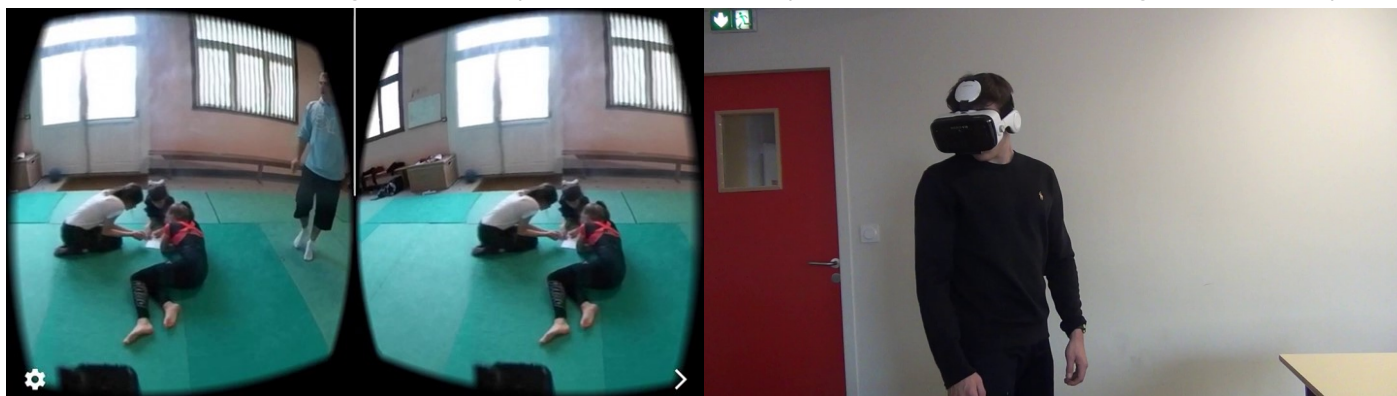
Figure 2. Usage des visio-casques en présentiel

permettre à la personne qui visionne de choisir et de pouvoir changer d'angle de vue. Le contexte sanitaire décrit nous a conduits à accélérer l'usage de ce type de vidéo en ligne.