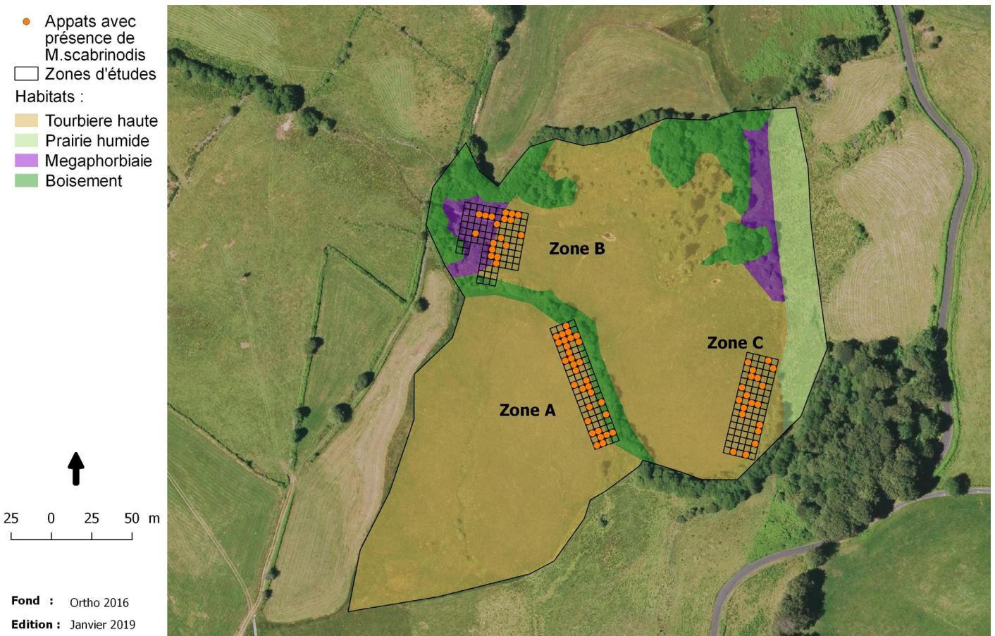
Figure 3 - Localisation des appâts positifs à la présence de Myrmica scabrinodis .