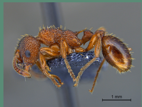
Du haut vers le bas: Myrmica rubra , M. ruginodis et M. scabrinodis

Densité de nids de Myrmica en tourbière : exemple de la tourbière de Jouvion (Puy-de-Dôme) Belenguier et al. / BIOM 1 (2020) : 35-48