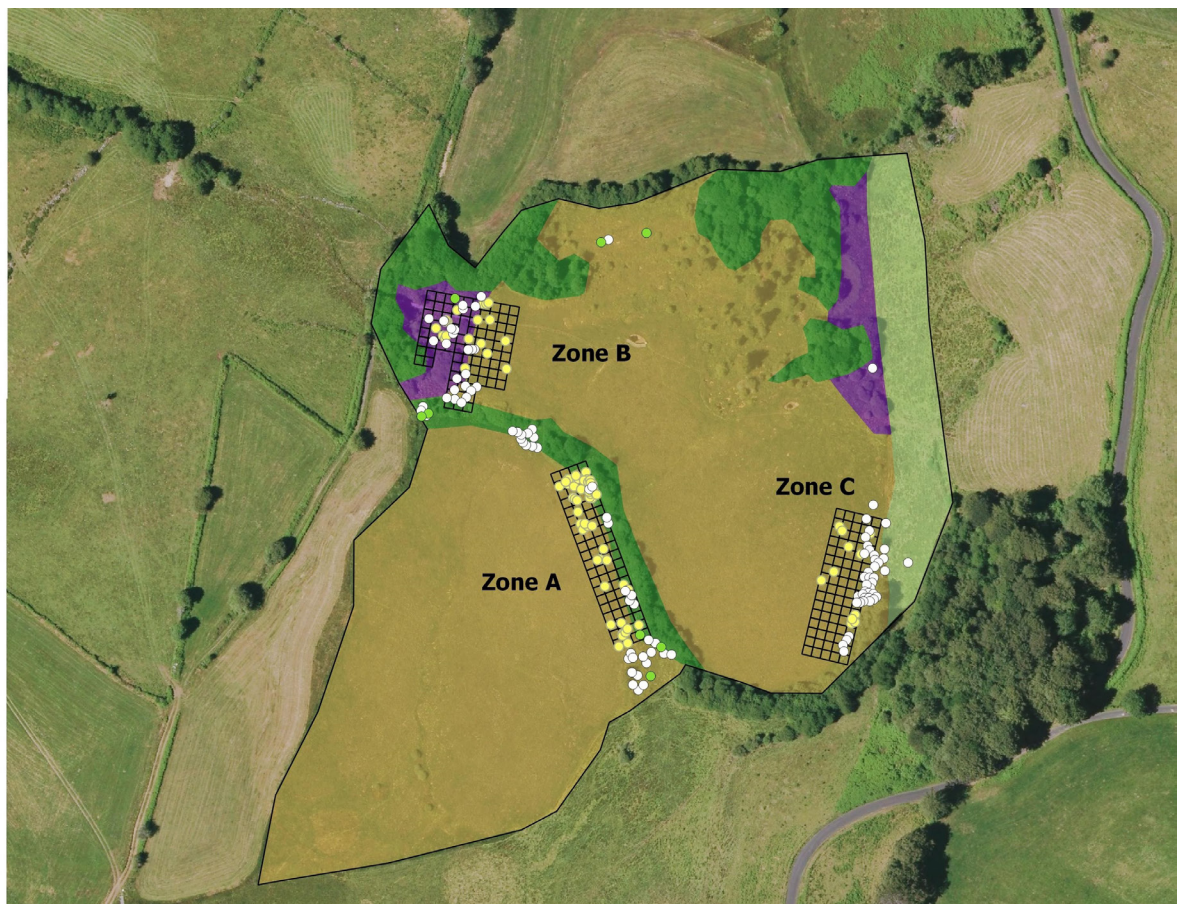
Figure 10 – Coexistence entre des nids de Myrmica scabrinodis et des pieds de Gentiane pneumonanthe .