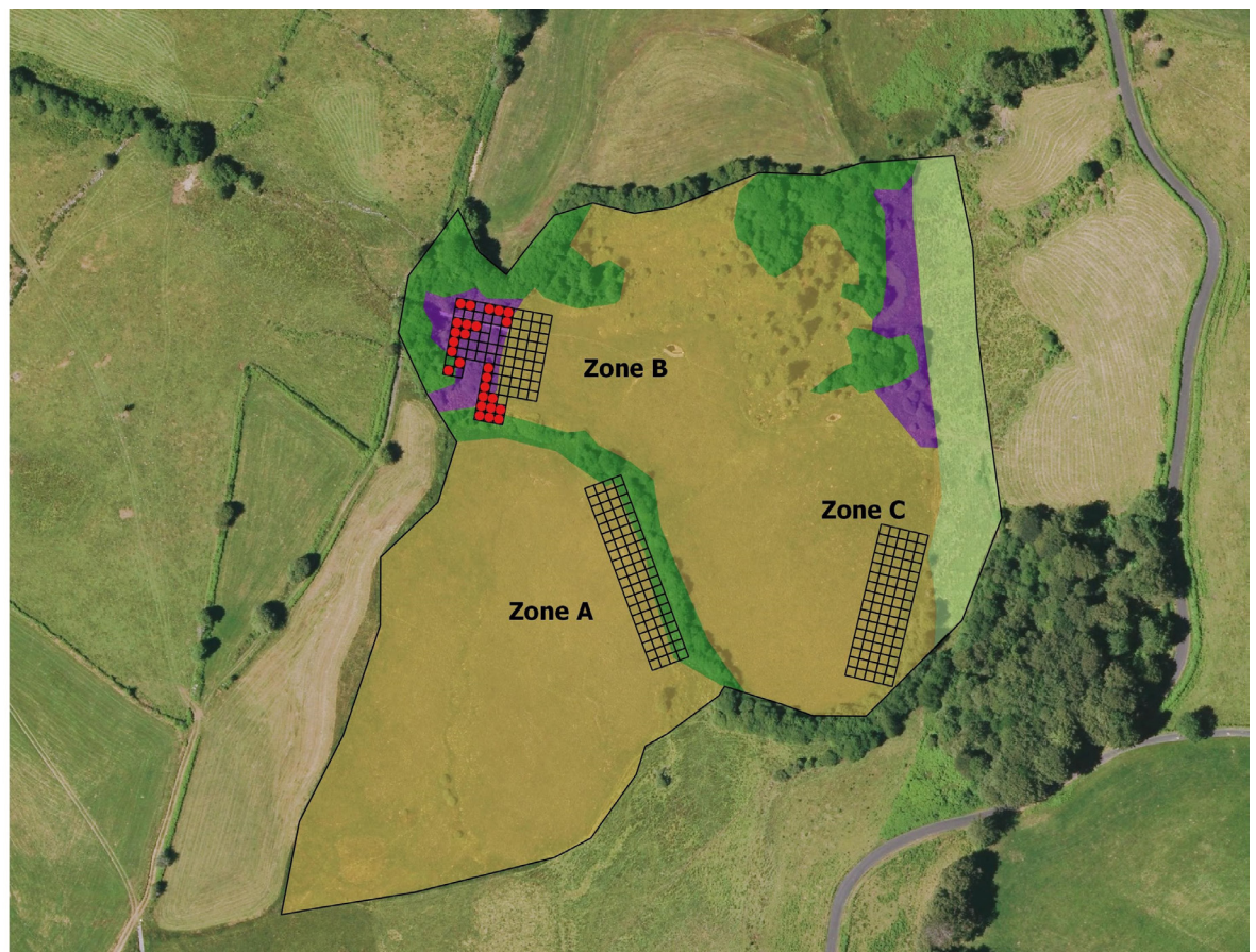
Figure 5 - Localisation des appâts positifs à la présence de Myrmica rubra .