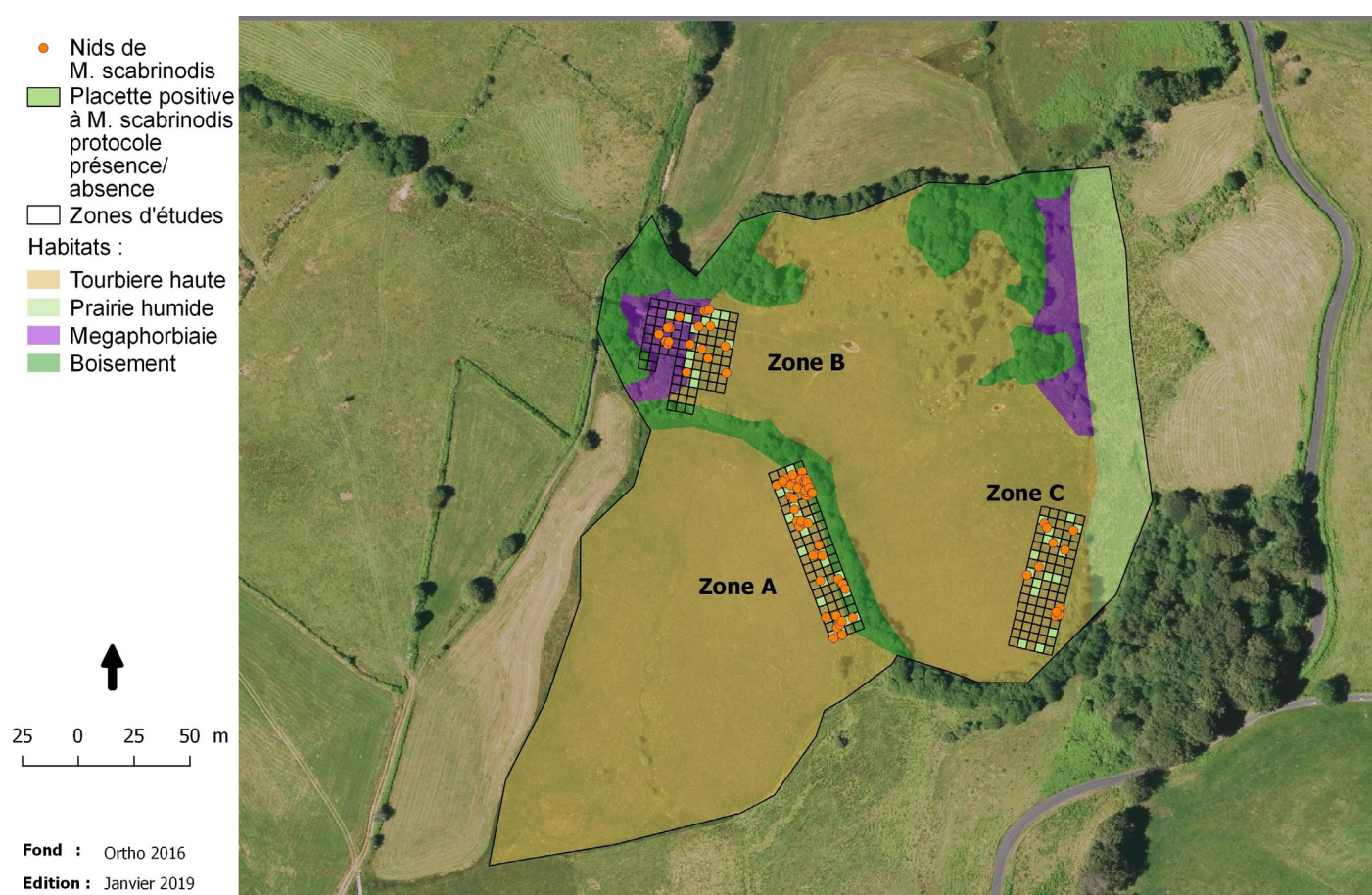
Figure 7 - Localisation des nids de Myrmica scabrinodis .

nids/100m 2 de M. scabrinodis . Myrmica ruginodis , elle, est présente ponctuellement sur les 3 zones (Fig. 8). Quant à Myrmica rubra est très présente dans la zone B, elle y est même dominante (Fig. 9).