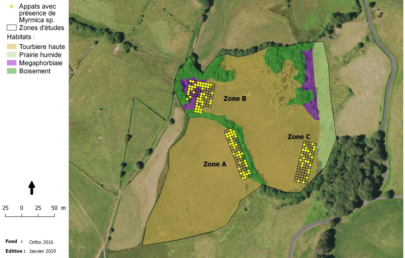
Figure 2 - Localisation des appâts positifs à la présence de Myrmica sp.