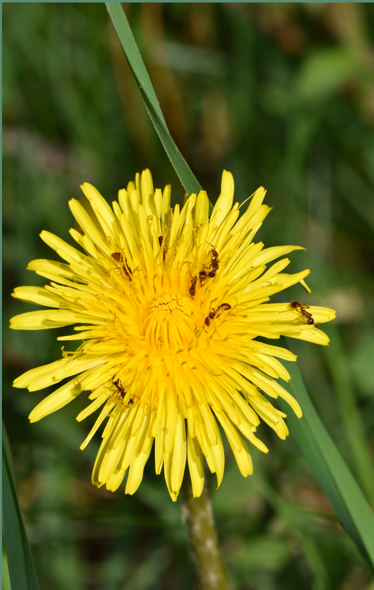
Myrmica ruginodis , cliché T. Delsinne

Revue scientifique pour la biodiversité du Massif central