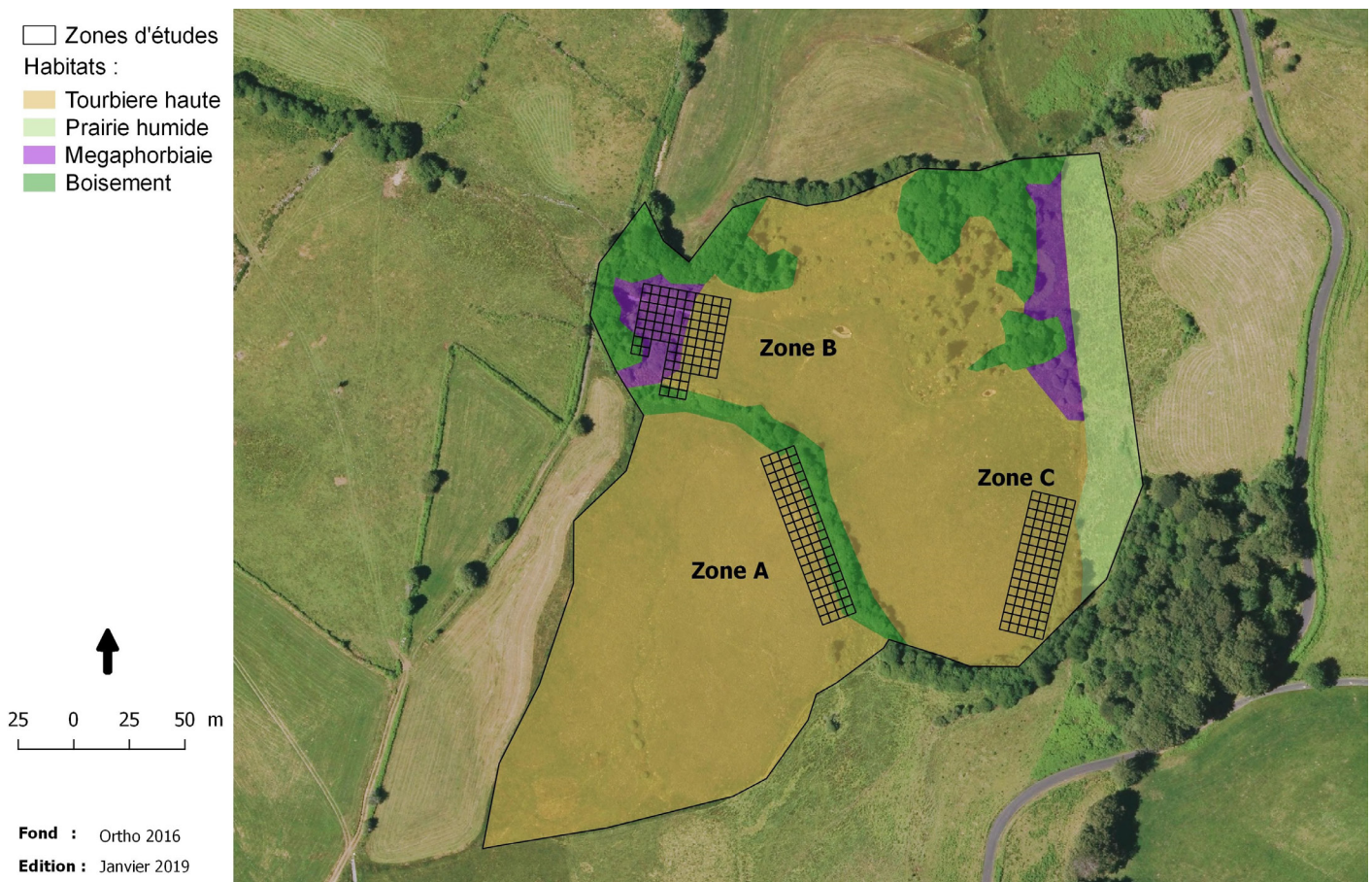
Figure 1 – Localisation des zones d'étude sur la tourbière de Jouvion.

L'azuré des mouillères est connu sur le site depuis 2005. Cinq zones de Gentiana pneumonanthe L., 1753 (plante hôte du papillon) sont présentes. Sur ces dernières ont été dénombrés 1512 œufs de Maculinea alcon alcon en 2008 et 1107 œufs en 2009 (Bachelard, com. pers.). La population était alors considérée comme d'intérêt départemental. Toutefois une baisse significative de la population a été constatée, puisqu'en 2011 aucun œuf n'était recensé et 111 l'étaient en 2014 (Bachelard, com. pers.). Plus récemment, une centaine d'œufs était comptée en 2015, 43 en 2016 (Belenguier et al. 2017) et enfin 98 en 2017 (Bachelard, com. pers.).