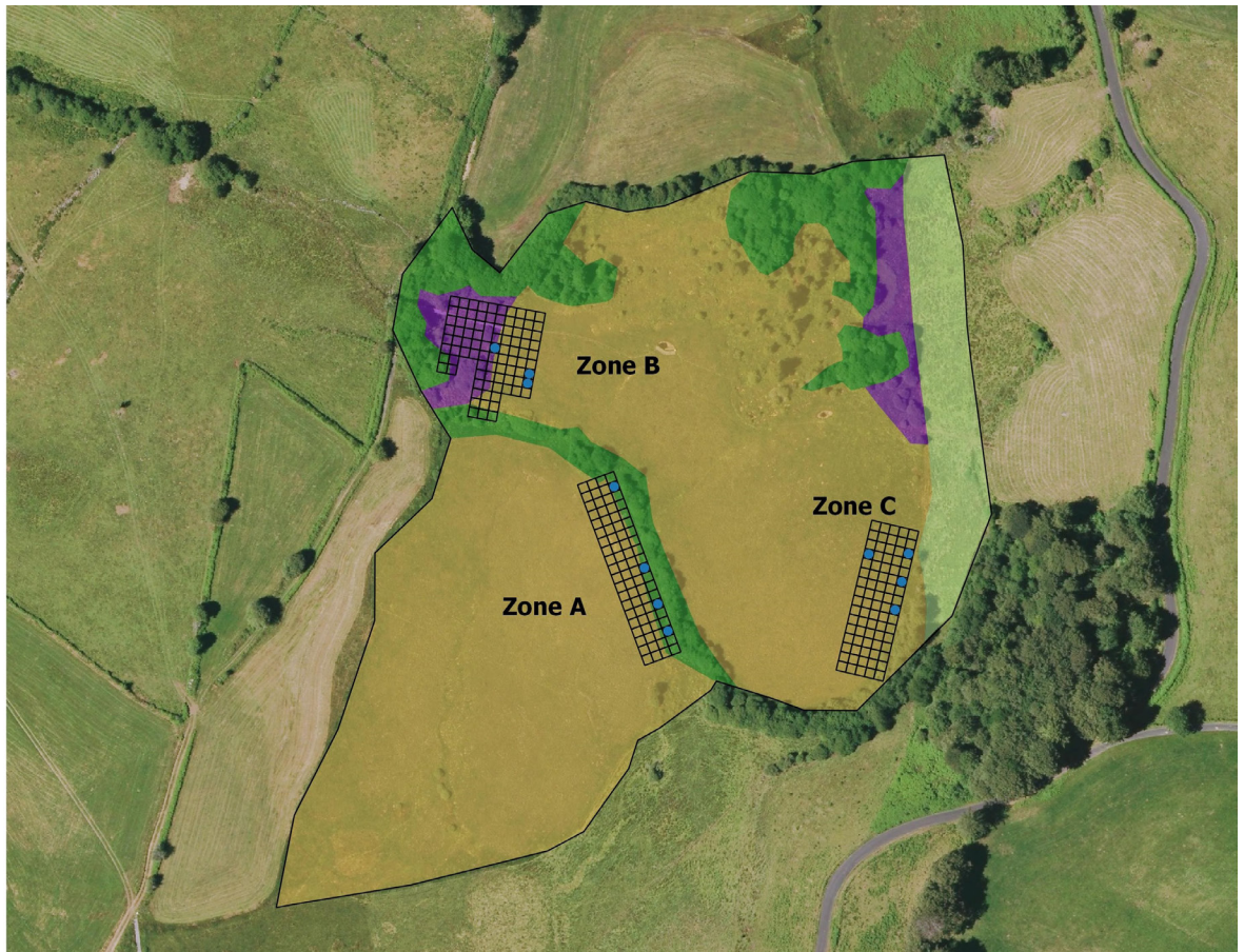
Figure 4 - Localisation des appâts positifs à la présence de Myrmica ruginodis .