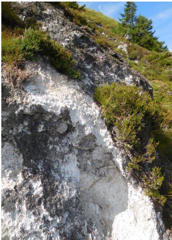
Figure 1 – Couloir domitique sur le versant nord du puy de Dôme. On distingue au premier plan une zone érodée, laissant apparaître la domite nue ; des landes cryophiles et au second plan, le Gymnomitrio corallioideis-Barbilophozietum sudeticae .