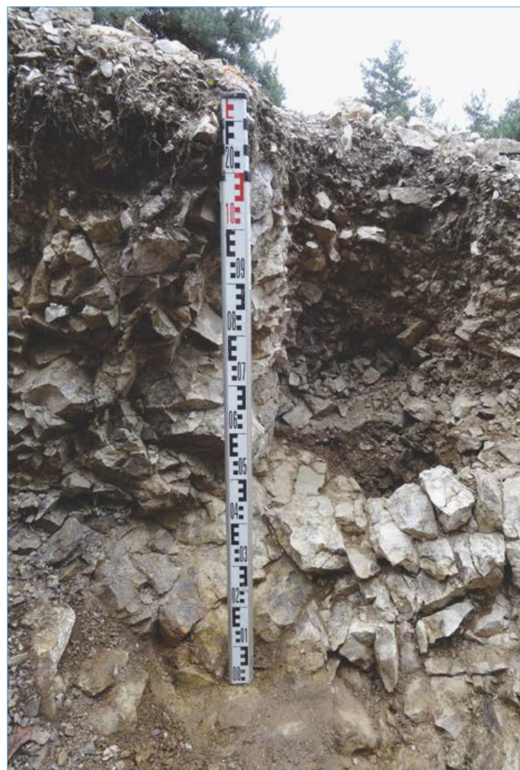
Fig. 1 : Saint-Pierre-Eynac, Rapavi - Vue de la probable fosse d'extraction du gisement principal.

L'élaboration depuis une dizaine d'année d'un protocole d'analyse spécifique des géoressources par notre