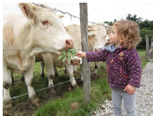
Encadré 4 Une initiative territoriale en faveur de l'agriculture : Mon voisin paysan