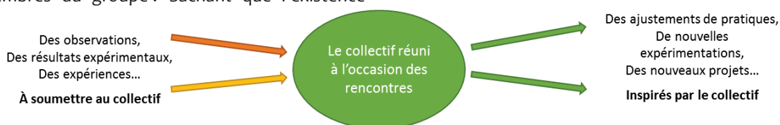
Figure 3 : l'itinéraire de production de savoirs au sein du groupe