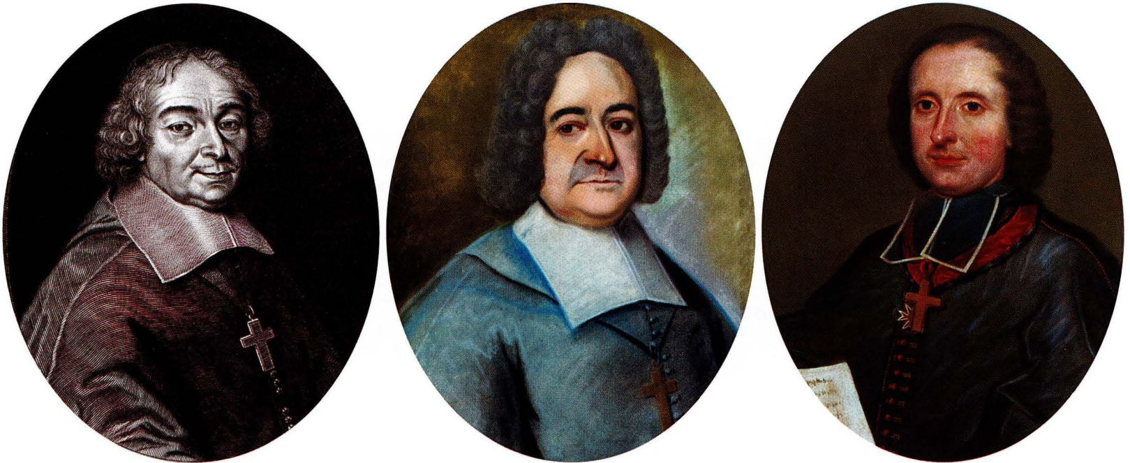
De gauche à droite : Louis d'Estaing, Gilbert de Veny d'Arbouze, Jean-Baptiste Massillon, François-Marie Le Maistre de La Garlaye.