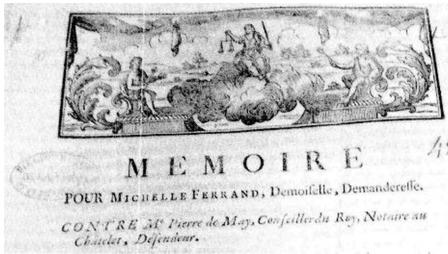
Enluminure exceptionnelle du Mémoire de 1742