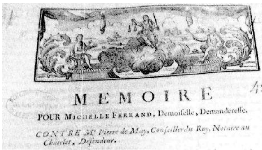
Enluminure exceptionnelle du Mémoire de 1742