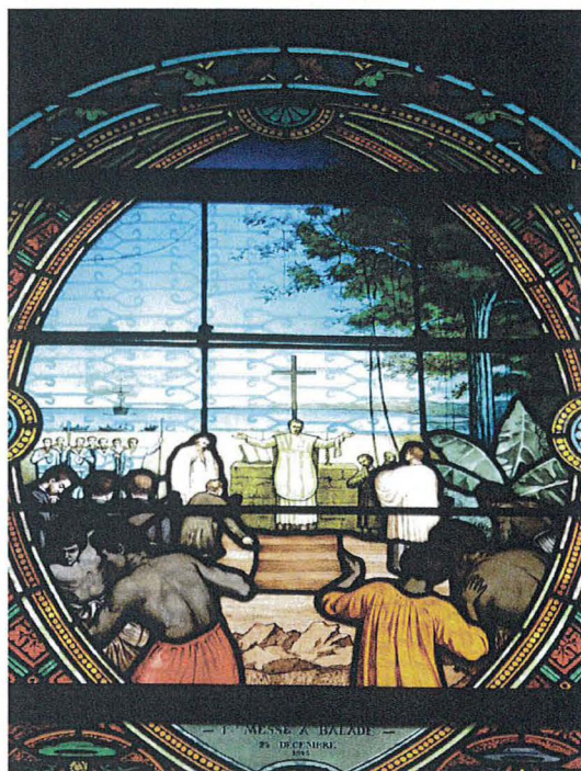
Vitrail de l'église de Balade, Nouvelle-Calédonie