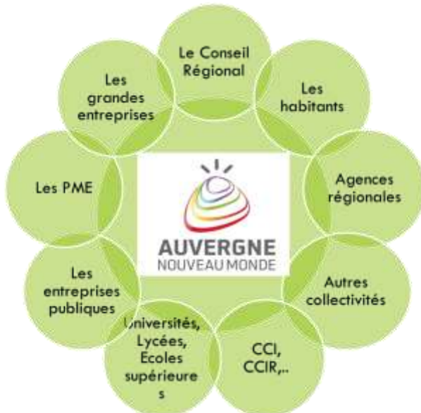
Figure 2. Écosystème de la marque Auvergne Nouveau Monde

marque Auvergne Nouveau Monde et ses parties prenantes.