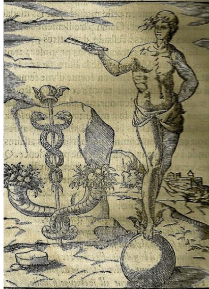
« La bonne Fortune », Les images des dieux des anciens , 1581.

goût marqué du public renaissant pour les allégories relatives au temps, ce temps qu'il est nécessaire de personnifier pour qu'il devienne moins abstrait et, par là-même, moins effrayant.