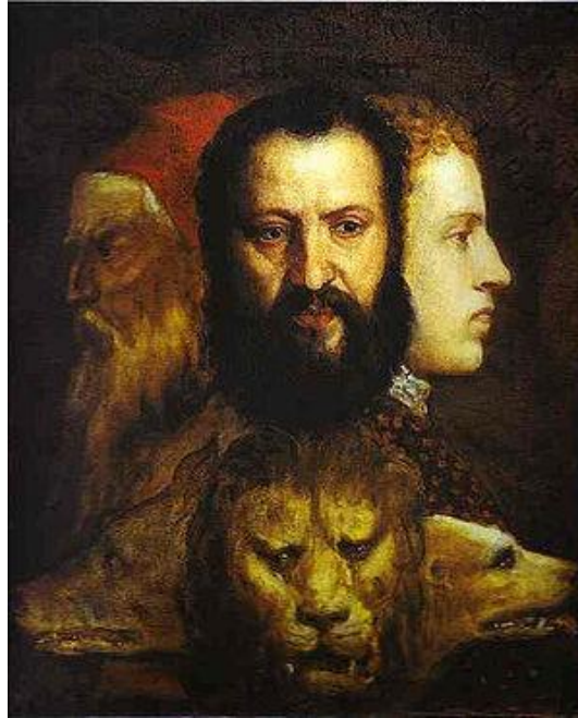
Le Titien, Allégorie de la Prudence (1565-1570), National Gallery, Londres.