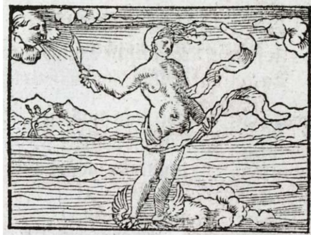
« Occasio », Livret des emblemes , 1536.

popularité nouvelle à la Renaissance 8 , à savoir la jeune femme Occasion, qui aurait été sculptée par Lysippe (« Je suis Occasion que Lysippus forma »), artiste grec du 4 e siècle avant Jésus-Christ. Sa tête a la particularité d'être chauve et de ne posséder qu'une seule mèche de cheveux sur le front, ce qui signifie qu'une fois passée, on ne peut plus l'attraper, et qu'il faut la saisir lorsqu'on la voit venir. Ses pieds sont ailés, car elle se hâte, et elle tient en outre un rasoir à la main, signe qu'elle taille tout ce qu'elle attrape.