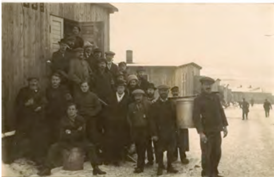
Fig. 1: Distribution de soupe aux prisonniers civils du camp de Holzminden, s. d., guerre de 1914-1918, photographie sur carte postale

sont affectés. Ces prisonniers civils ne représentent qu'une facette d'un sort partagé par des millions d'êtres humains pendant la Grande Guerre et, avant elle, au cours d'un long XIX e siècle 2 .